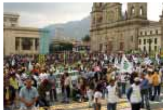
Trabajadores de la salud de todo el país se tomaron la Capital.