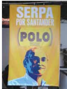
El Polo respalda a Serpa en Santander.