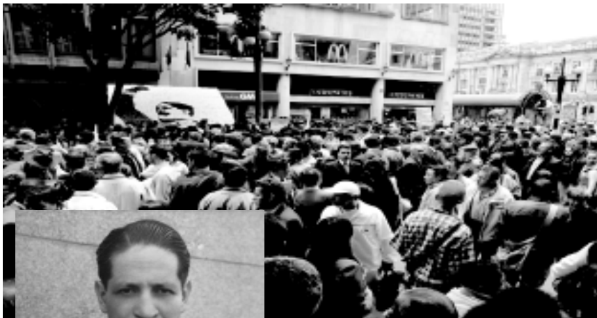
El 9 de abril de 2008, la multitud se congrega en el sitio donde Gaitán cayó acbillado.