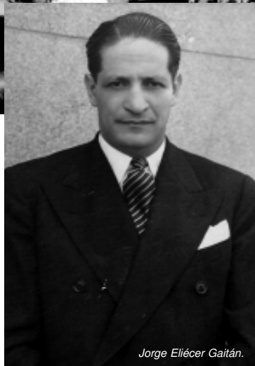
Jorge Eliécer Gaitán.